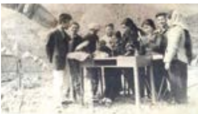
Thầy và trò trường Đại học Tổng hợp Hà Nội trong thời gian sơ tán lên huyện Đại Từ, tỉnh Bắc Thái. Lãnh đạo nhà trường phân các khoa về các xã Văn Yên, Ký Phú, Vạn Thọ, Lục Ba.

Hầu hết cán bộ và sinh viên đều ở nhờ nhà dân, chỉ nơi nào dân quá thưa mới phải làm nhà ở. Mỗi Khoa xây dựng: một nhà làm việc của Ban Chủ nhiệm Khoa và văn phòng; một nhà làm phòng họp, đồng thời làm nơi sinh hoạt chung của Khoa; một thư viện và bên cạnh là phòng đọc. Mỗi lớp sinh viên xây dựng một nhà ăn có bếp nấu bên cạnh và một lớp học. Tất cả các nhà đều lợp bằng tranh nứa, che bằng phen đan. Bàn học, ghế ngồi đều tự tạo bằng cách cắm cọc xuống đất làm chân, đặt 5 cây luống làm mặt bàn, 3 cây luống làm mặt ghế.