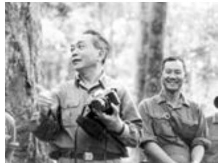
Đại tướng Võ Nguyên Giáp

M ột đóng góp khác không thể không nhắc đến của Đại học Đông Dương đó là từ đây có những cá nhân xuất sắc có đóng góp lớn cho Cách mạng Việt Nam như: Đồng chí Đặng Xuân Khu (tức Tổng Bí thư Trường Chinh), đã từng là sinh viên của Trường Thương mại thuộc Đại học Đông Dương, sau này thành Tổng Bí thư của Đảng; Khóa I (5/1941 - 2/1951), khóa II (2/1951 - 10/1956); Đại tướng Võ Nguyên Giáp - sinh viên Khoa Luật - Đại học Đông Dương, sau này trở thành Đại tướng Tổng tư lệnh của Quân đội Nhân dân Việt Nam... Truyền thống này lại được tiếp nối bởi các thế hệ sau đó. Trong kháng chiến chống Pháp, sinh viên ngành Y - Dược di tản vào chiến khu có đóng góp rất lớn cho kháng chiến.