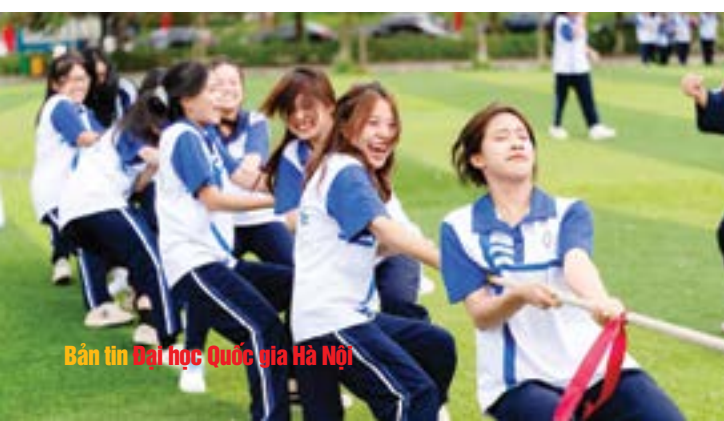
Bản tin Đại học Quốc gia Hà Nội

N gày 19/05/2022, nhân dịp kỷ niệm 132 năm ngày sinh Chủ tịch Hồ Chí Minh, cũng là dấu ấn đặc biệt của ĐHQGHN khi toàn bộ Cơ quan chuyển trụ sở chính tới Hòa Lạc. Sự quan tâm, chỉ đạo của lãnh đạo Đảng và Nhà nước, cùng mạng lưới hợp tác chất lượng trong nước và quốc tế cùng quyết tâm của cả tập thể đã giúp mục tiêu xây dựng và phát triển Khu đô thị ĐHQGHN ngày càng vững chắc, là cơ sở để ĐHQGHN thực hiện Chiến lược phát triển từ nay đến năm 2030, tầm nhìn đến 2045.