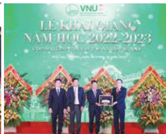
Chủ tịch Quốc hội Trần Thanh Mẫn dự lễ khai giảng năm học 2022 - 2023 của ĐHQGHN tại Hòa Lạc.