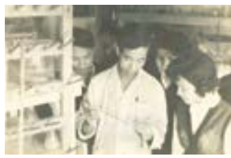
Trong điều kiện khó khăn tại các khu sơ tán cán bộ và sinh viên Trường Đại học Tổng hợp Hà Nội vẫn miệt mài học tập và nghiên cứu khoa học.