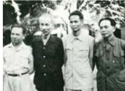
Tổng Bí thư Trường Chinh (ngoài cùng bên trái)