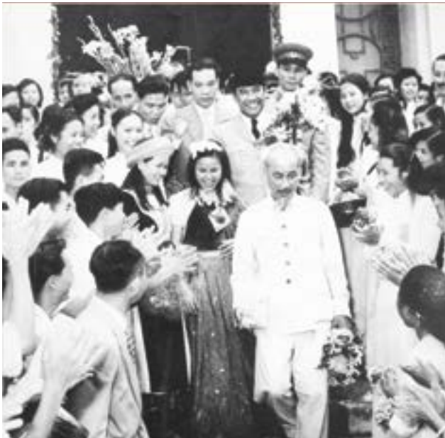
Chủ tịch Hồ Chí Minh đến thăm Trường Đại học Tổng hợp Hà Nội, năm 1959.

Theo Quyết định số 2183/TC ngày 04/6/1956 của Chính phủ, Trường Đại học Tổng hợp Hà Nội và Trường Đại học Sư phạm Hà Nội được thành lập.