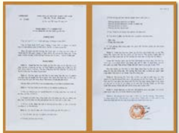
Nghị định 97/CP ngày 10/12/1993 về việc thành lập ĐHQGHN.

*Năm 1999, theo Quyết định số 201/QĐ-TTg, Trường ĐH Sư phạm Hà Nội tách khỏi ĐHQGHN.