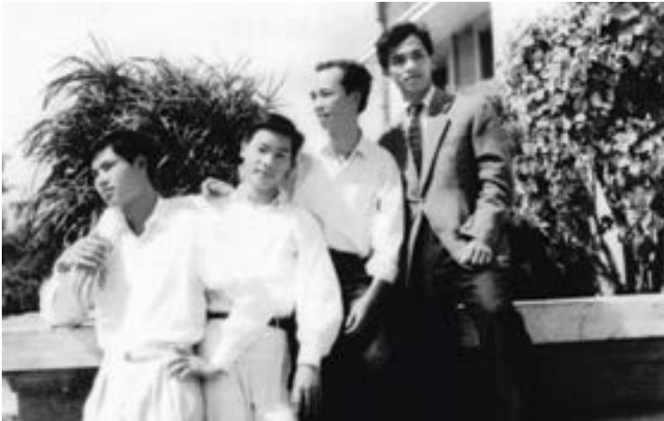
Tổng Bí thư Nguyễn Phú Trọng là cựu sinh viên Khoa Ngữ Văn, Trường Đại học Tổng hợp Hà Nội (người đứng thứ hai từ trái sang, Kỳ túc xá Mỹ Trì, tháng 2/1965).

Năm 1965, Trường Đại học Tổng hợp Hà Nội sau 9 năm thành lập đang đi vào giai đoạn phát triển, khắp nơi thi đua giảng dạy, học tập vì miền Nam ruột thịt, nhưng thực hiện chủ trương và theo quyết định của Nhà nước, Trường đã sơ tán lên huyện Đại Từ, tỉnh Bắc Thái (nay là tỉnh Thái Nguyên). Khối Hiệu bộ và các Khoa Toán, Lý, Hóa ở xã Văn Yên; Khoa Sinh vật ở xã Ký Phú; Khoa Văn và Khoa Sử ở xã Vạn Thọ.