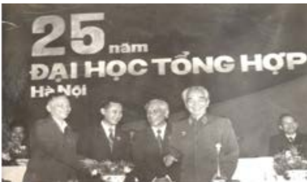
Đại tướng Võ Nguyên Giáp về thăm Trường trong Lễ kỷ niệm 25 năm Thành lập (1981).

Trường Đại học Tổng hợp Hà Nội trực tiếp kế thừa truyền thống và cơ sở vật chất, kỹ thuật của Đại học Đông Dương (1906), Trường Đại học Quốc gia Việt Nam (1945) và Trường Khoa học Cơ bản (1951).